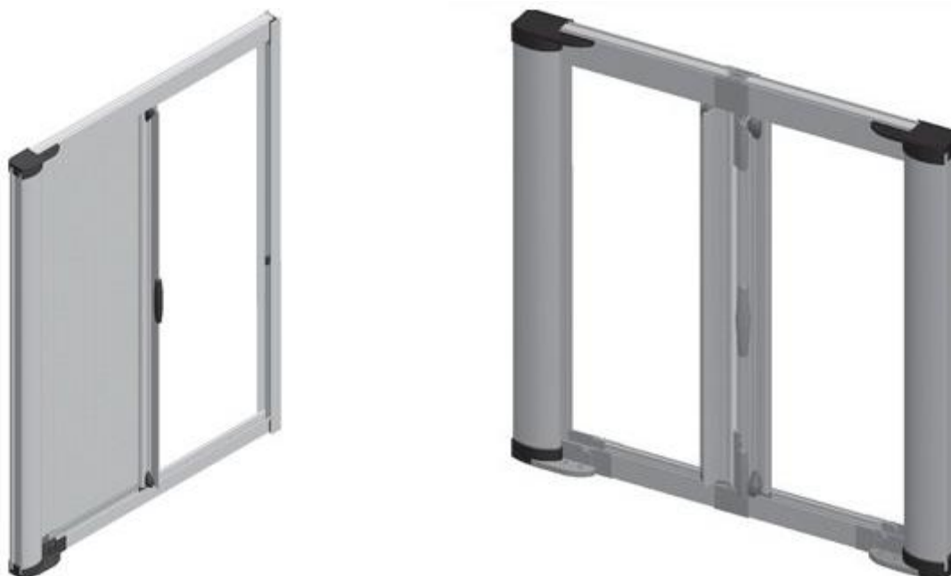
Εικόνα 1 _ Σίτα Οριζόντιας Κίνησης