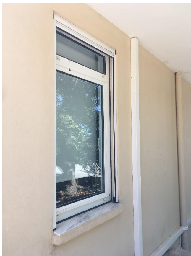
Εικόνα 4_ Υφιστάμενη Σίτα παραθύρου κάθετης κίνησης