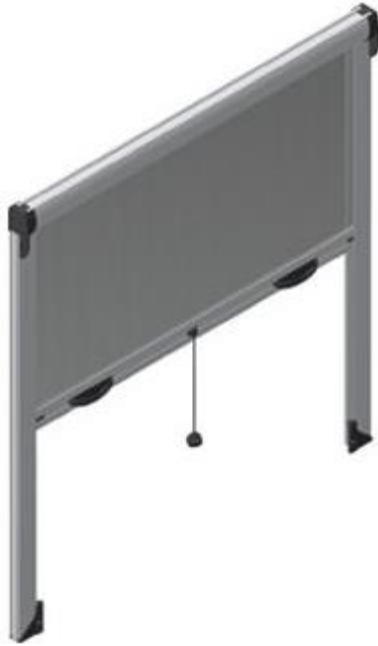
Εικόνα 3_ Σίτα σταθερή