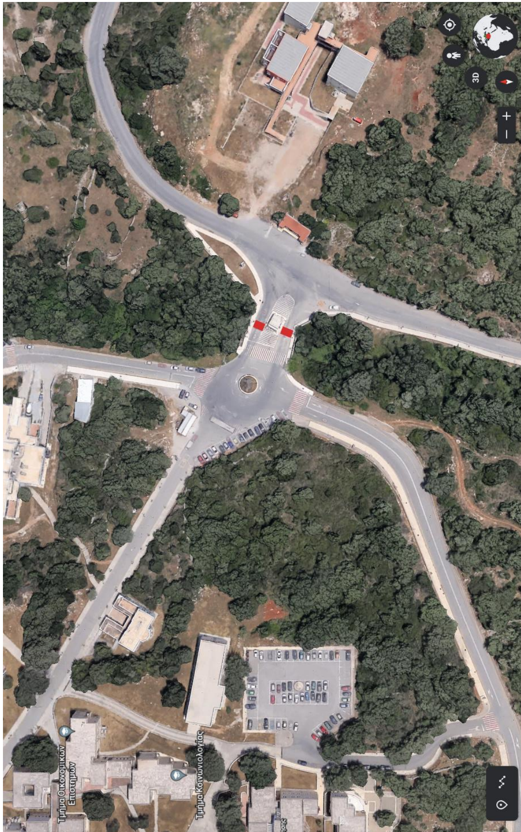
ΧΑΡΤΗΣ 2. ΠΑΝΕΠΙΣΤΗΜΙΟΥΠΟΛΗ ΓΑΛΛΟΥ