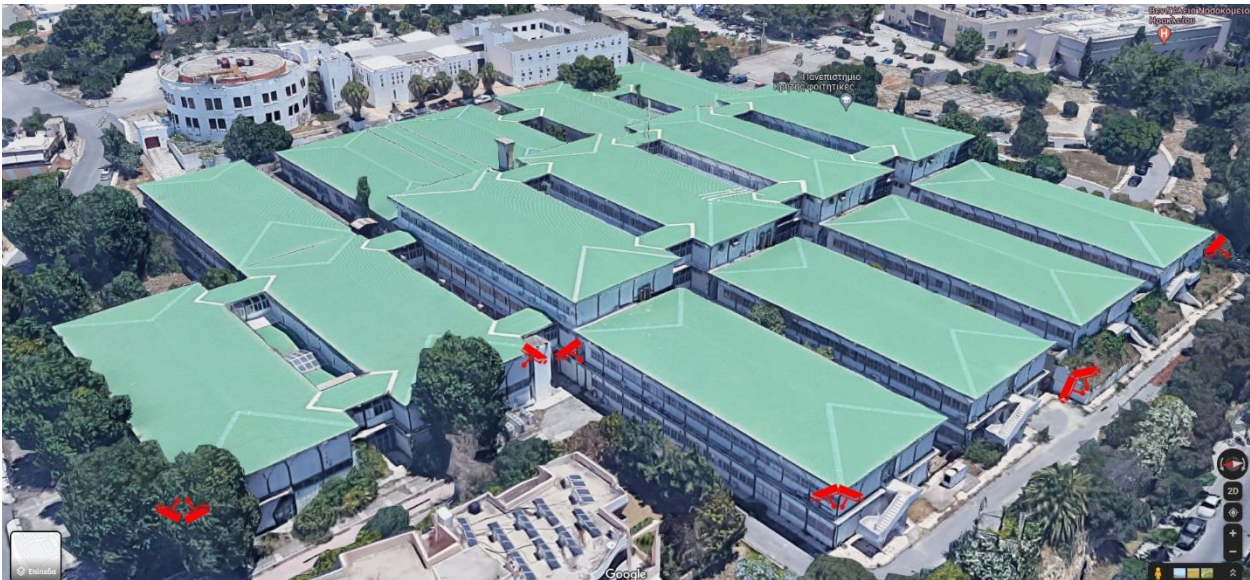
Εικόνα 3.Κάμερες Ασφαλείας στα Προκατασκευασμένα κτίρια Νοτιοδυτικά.