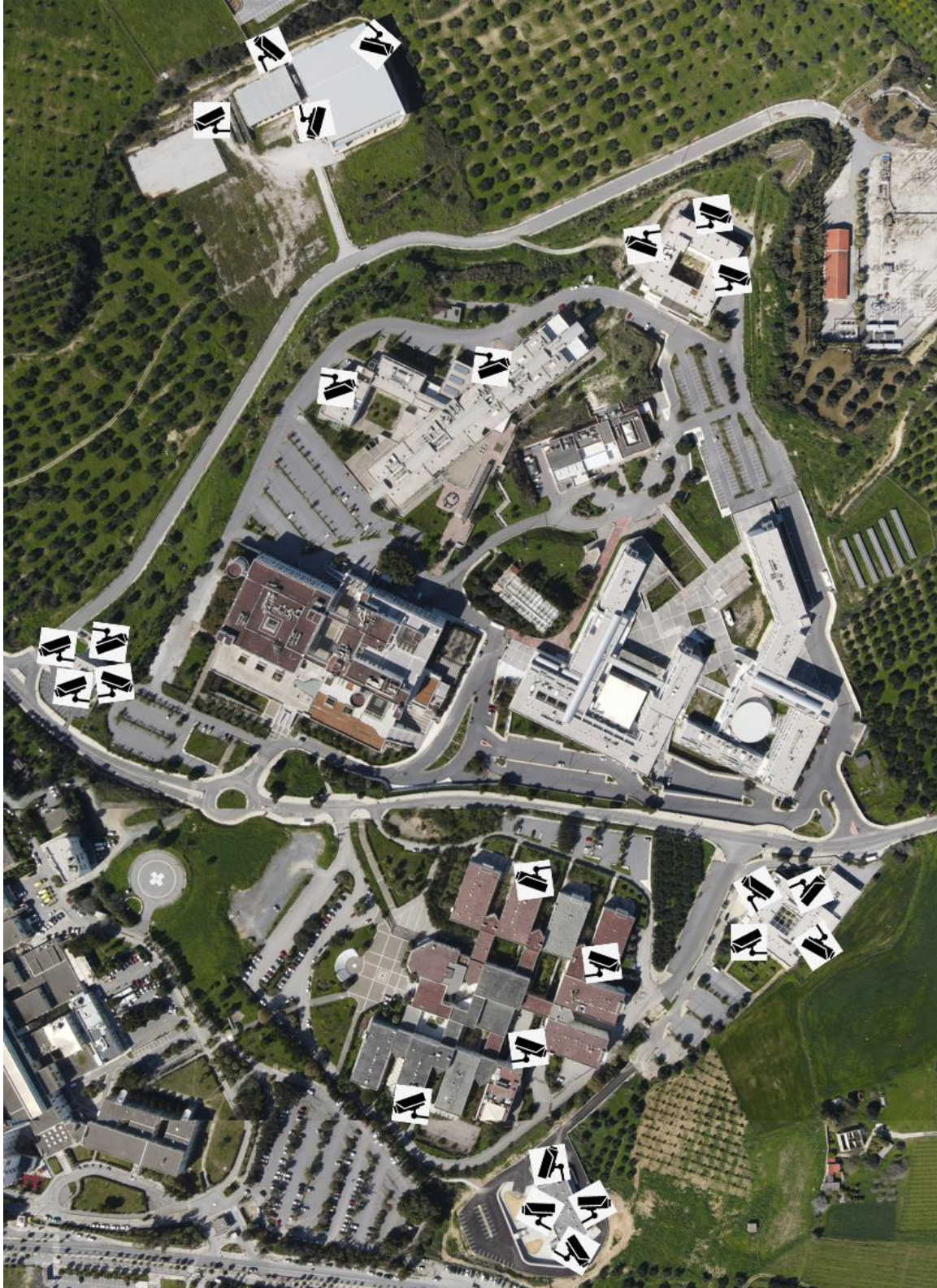
Εικόνα 6.Ενδεικτικές θέσεις τοποθέτησης καμερών ασφαλείας για κάλυψη εξωτερικών χώρων του Π.Κ. Βουτών.