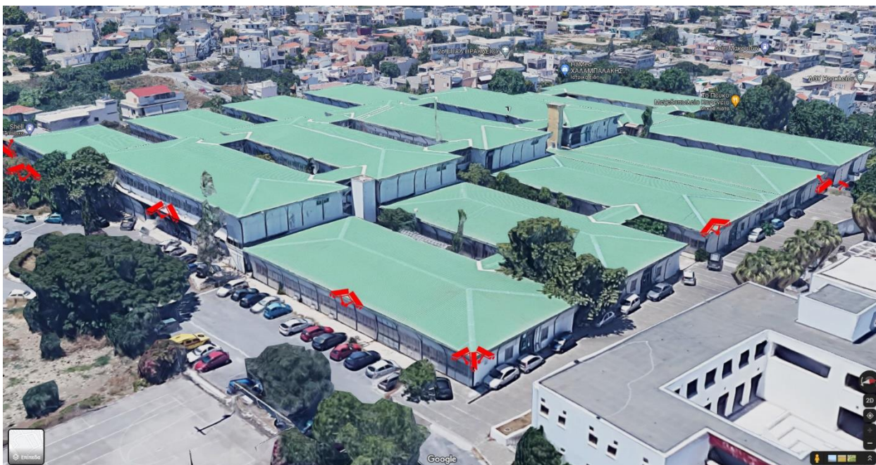
Εικόνα 1.Κάμερες Ασφαλείας στα Προκατασκευασμένα κτίρια Βορειοανατολικά.