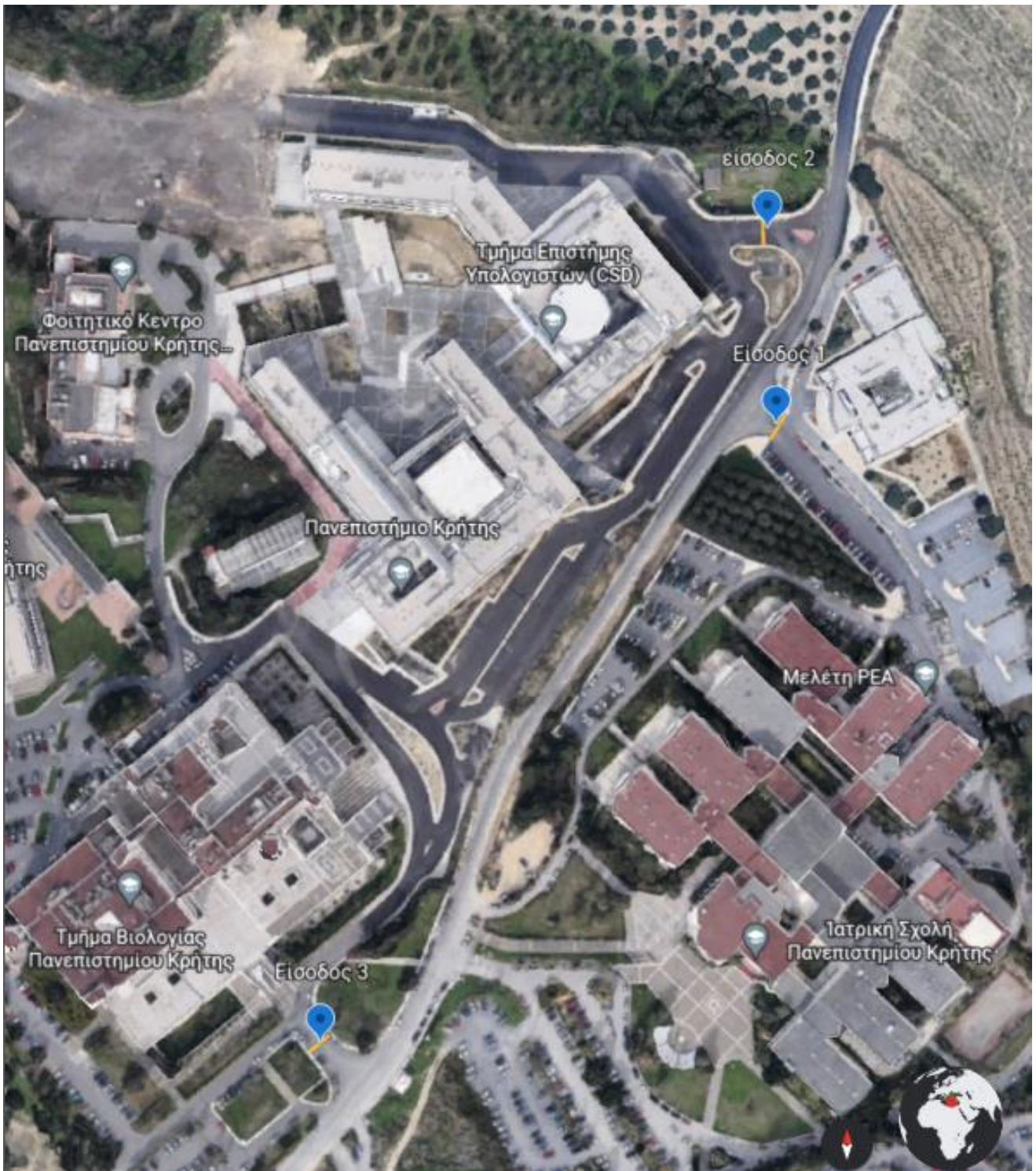
ΧΑΡΤΗΣ 1. ΠΑΝΕΠΙΣΤΗΜΙΟΥΠΟΛΗ ΒΟΥΤΩΝ