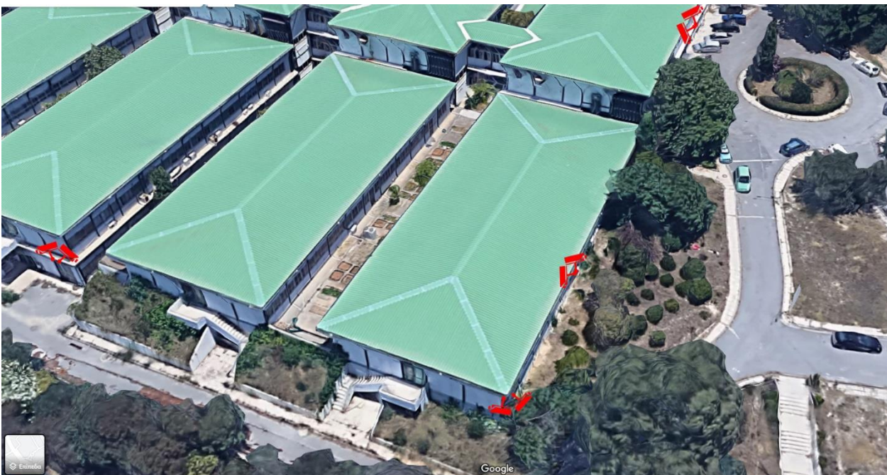
Εικόνα 4.Κάμερες Ασφαλείας στα Προκατασκευασμένα κτίρια Νοτιοανατολικά.