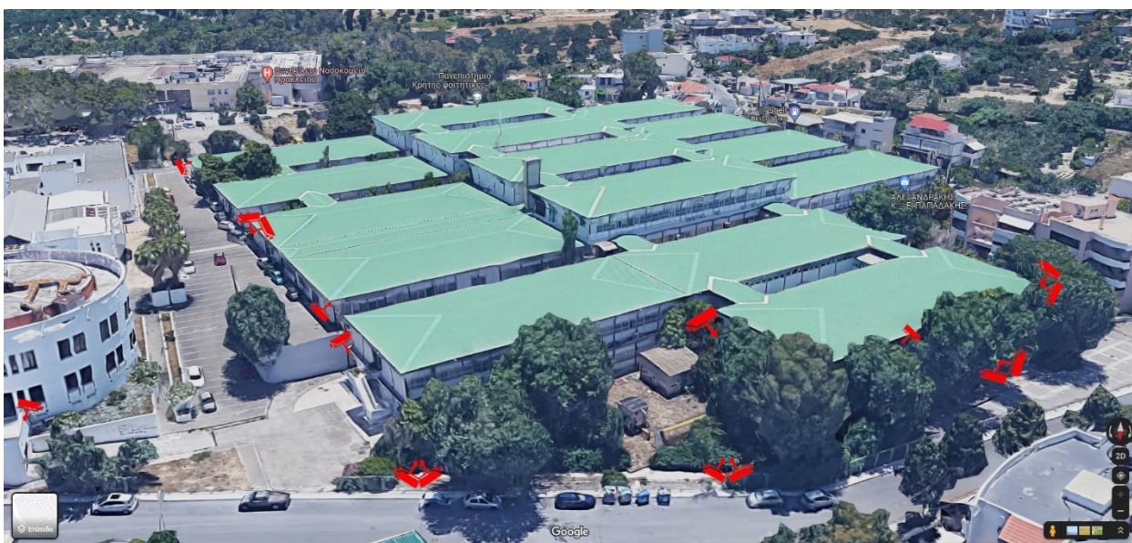
Εικόνα 2.Κάμερες Ασφαλείας στα Προκατασκευασμένα κτίρια Βορειοδυτικά.