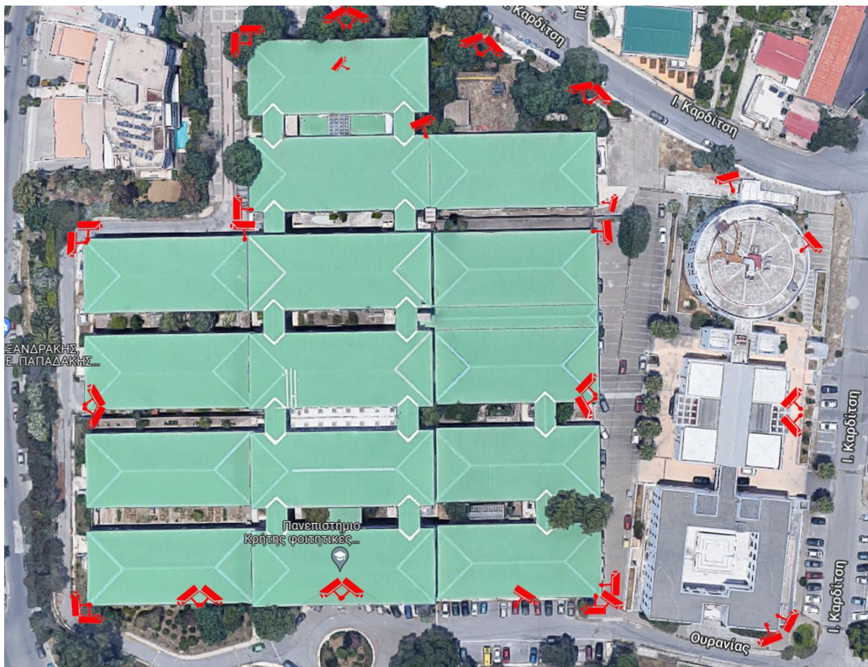
Εικόνα 5.Κάμερες Ασφαλείας σε όλα τα κτίρια. - Συνολικά 36